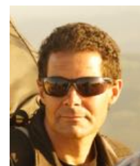
Présenté par Stéphane Liabeuf